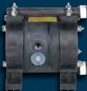
Насос NDP-5 Кунар® (PVDF- Поливинилиденфторид) Габариты: 156 мм x 152 мм Вес нетто: 1,67 кг Вес брутто: 2,1 кг