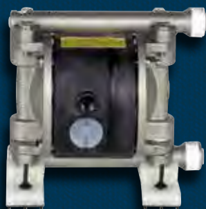
Насос NDP-5 Нержавеющая сталь Габариты: 155 мм x 149 мм Вес нетто: 2,68 кг Вес брутто: 3,1 кг